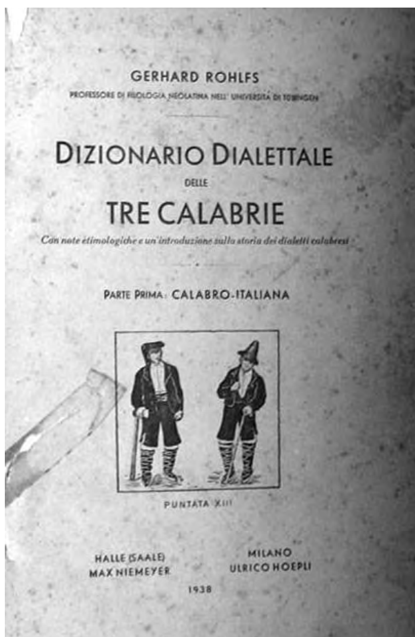
Dizionario del 1938